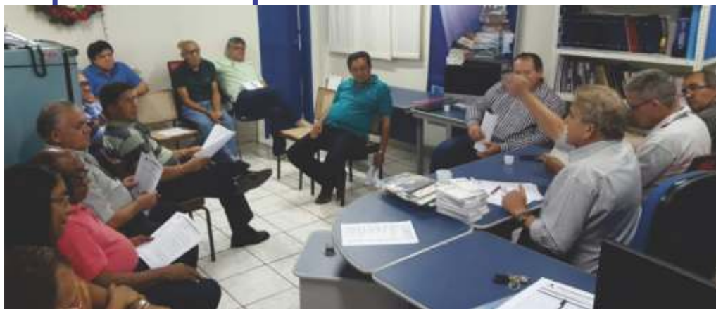
Engenheiros discutiram o plano de atividades do sindicato

No último dia 17, a diretoria do Sindicato dos Engenheiros se reuniu na segunda assembleia geral do ano para apreciar e votar a proposta orçamentária, o plano de trabalho, a contribuição sindical e associativa 2016, além da filiação à União Geral dos Trabalhadores (UGT), entre outros assuntos.