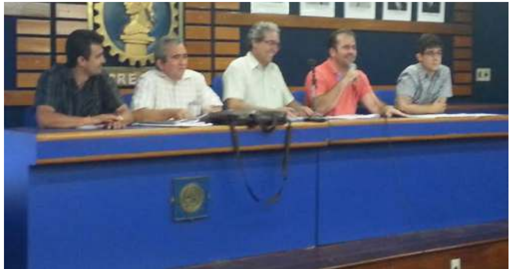
Discussão da nova minuta do plano de cargos ocorreu na sede do Crea-PI

Entre os principais pontos da proposta está a remuneração inicial no valor de R$ 8.321,10 e final de R$ 16.399,47, além organização da carreira em três classes, cada uma com seis níveis. A remuneração de engenheiro, arquiteto e agrônomo será composta do vencimento e da gratificação de produtividade